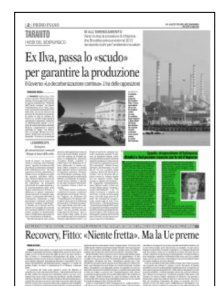
Superficie 10 %

ARTICOLO NON CEDIBILE AD ALTRI AD USO ESCLUSIVO DEL CLIENTE CHE LO RICEVE - L.1849 - T.1849