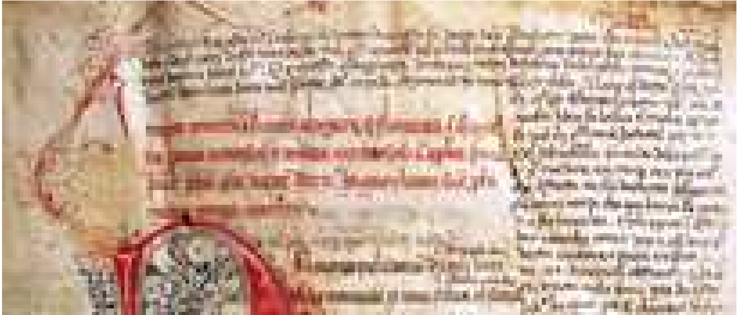
Svelati dopo 7 secoli i testi fantasma di un codice dantesco