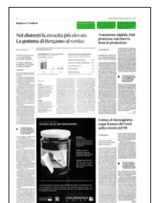
Superficie 2 %

ARTICOLO NON CEDIBILE AD ALTRI AD USO ESCLUSIVO DEL CLIENTE CHE LO RICEVE - L.1956 - T.1677